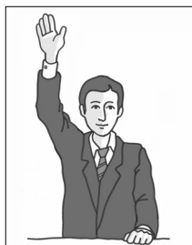
"Balle à remettre"